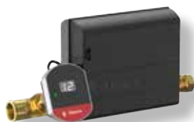
Flexcon PA AutoFill