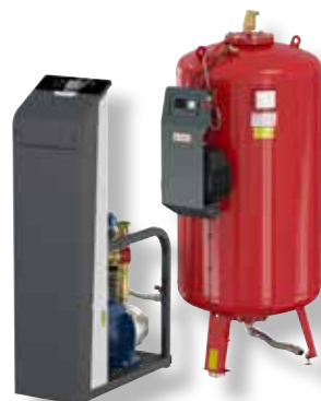
Flexcon M-K/U G4 (ab Q4 - 2021)